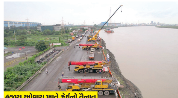
હજીરા ઓવારા ખાતે કેઈનો તેનાત