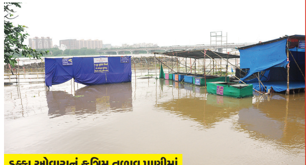
55કા ઓવારાનું કૃત્રિમ તળાવ પાણીમાં

સુરત, તા. ૫ પ્રાણ પ્યારા આરાધ્ય દેવનાં દસ દિવસ પૂજન, અર્ચન બાદ હવે ભાવભીની વિદાયનો સમય આવી ગયો છે. શનિવારે અંત યતુર્દશીનાં દિવસે શહેરમાં ૨૧ કૃત્રિમ તળાવ અને ત્રણ ઓવારેથી ૮૫ હજારથી વધુ પ્રતિમાઓનું વિસર્જન કરાશે. વિધ્નહર્તાદેવની વિસર્જન યાત્રા નિર્વિધ્ને પાર પડે એ માટે પોલીસ અને પાલિકા તંત્ર દ્વારા પુરતી વ્યવસ્થા કરવામાં આવી છે. વિસર્જન યાત્રા દરમિયાન કાચદો