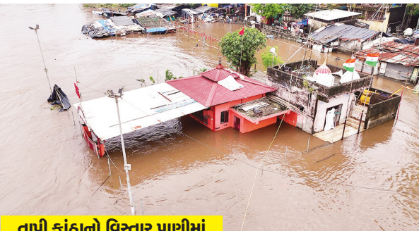
તાપી કાંઠાનો વિસ્તાર પાણીમાં